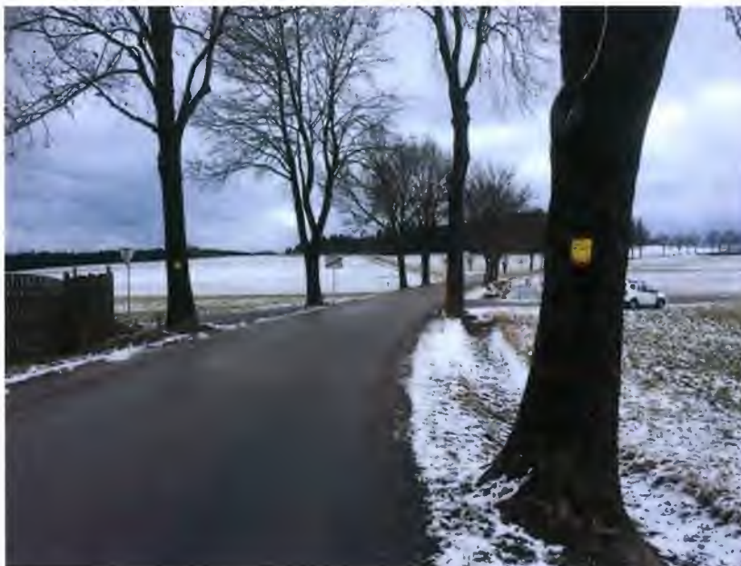
Baum Nr. 92 (mit Tafel) am linken Bildrand, Baum Nr. 93 (mit Tafel) am rechten Bildrand

An der westlichen Straßenseite wurden drei Bäume auf Höhe des Grundstückes Nr. 2 ebenfalls bereits entfernt. An dieser Straßenseite beginnt die Allee am Ortsrand mit dem Baum Nr. 92 auf Höhe von km 4,602. Auf diesem ist ebenfalls eine Kennzeichnungstafel angebracht (siehe Foto).