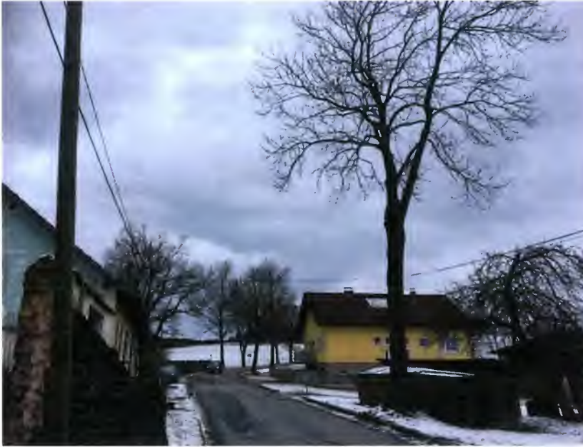
Baum Nr. 94 innerhalb des Ortsbereiches; bestehende Lücke in der Bildmitte (zwei fehlende Bäume) und am linken Bildrand (drei fehlende Bäume)

Der nächstgelegene Baum Nr. 93 an der östlichen Straßenseite befindet sich bereits außerhalb des verbauten Ortsbereiches, rund 60 m nordwestlich von Baum Nr. 94 bei km 4,616. Auf diesem Baum ist auch die Kennzeichnung des Naturdenkmals angebracht (siehe Foto).