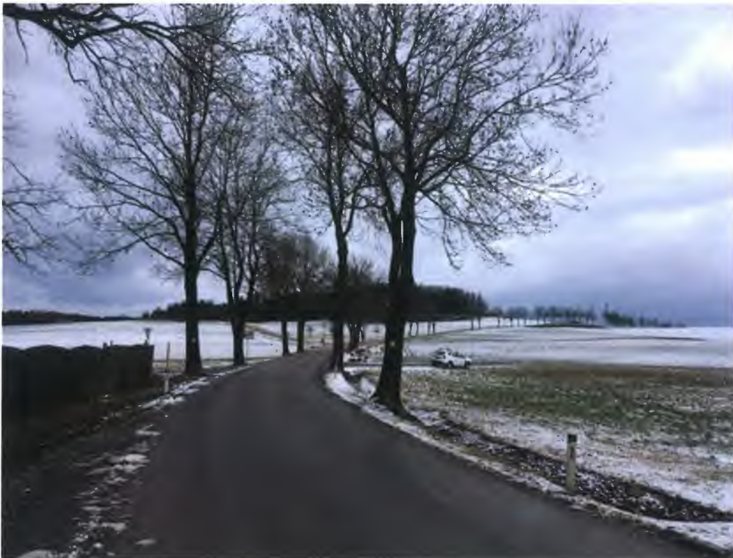
aktueller Beginn der Allee am Ortsrand von Haslau mit weiterem Verlauf Richtung Seyfrieds

Im Rahmen der Begehung wurde jedenfalls festgestellt, dass der Charakter einer landschaftsprägenden Allee erst ab den am Ortsrand befindlichen, mittels Naturdenkmal-Tafeln markierten Bäumen gegeben ist (siehe Foto). Der noch vorhandene Baum Nr. 94 südlich davon innerhalb der Ortschaft hat keine räumliche Anbindung zur Allee und entfaltet auch keinerlei Wirkung auf das Landschaftsbild.