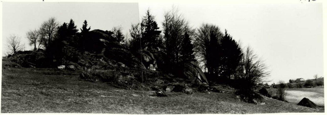
ANSICHT AUS SSW