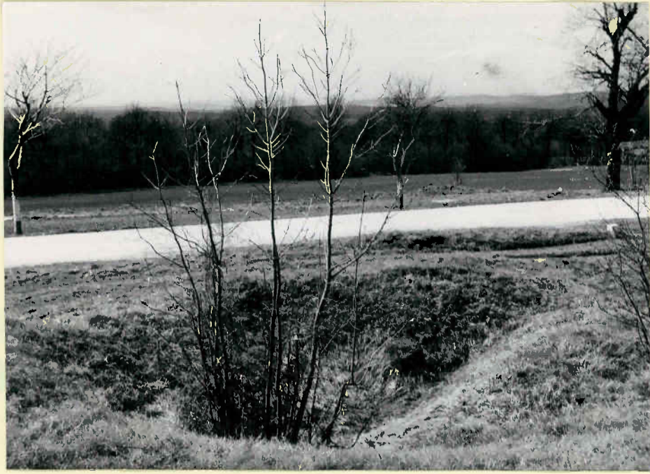
Trichterdoline im Wiesengelände in der Umgebung der Klafferbrunnerhöhle