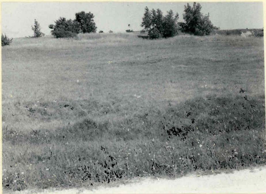
Geschütztes Wiesengelände mit seichten Dolinen; der Eingang in die Klafferbrunnerhöhle liegt rechts im Hintergrund, vor der sichtbaren Steinbruchwand.