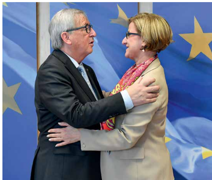
Landeshauptfrau Johanna Mikl-Leitner traf in Brüssel mit EU-Kommissionspräsident Jean-Claude Juncker zu einem Arbeitsgespräch zusammen.

Neue Standpunkte des aktuellen Papiers sind etwa die Stärkung des Subsidiaritätsprinzips und der Bedeutung der Europäischen Union als entscheidende Faktoren für die Zukunft Europas, das Bekenntnis zur Konzentration der Förderung auf die wichtigsten regionalen Herausforderungen und Prioritäten im Einklang mit den EU-Zielen sowie die Forderung nach Vereinfachung und