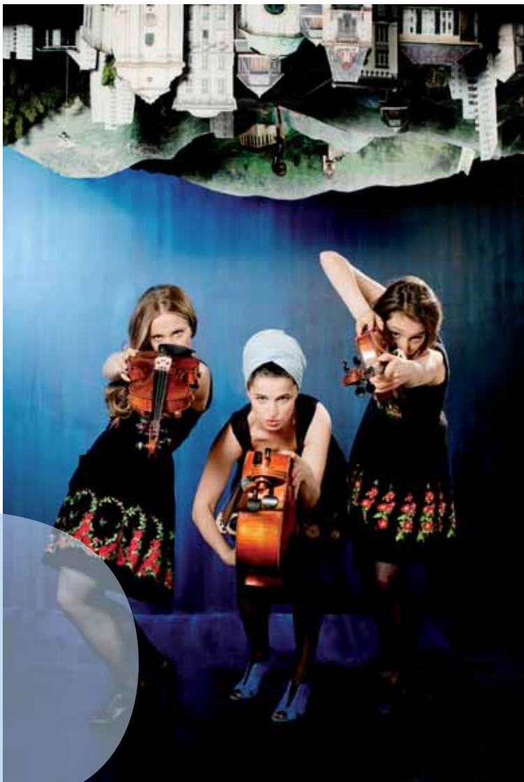
Netnakisum – Musikkabarett, Neuhofen an der Ybbs