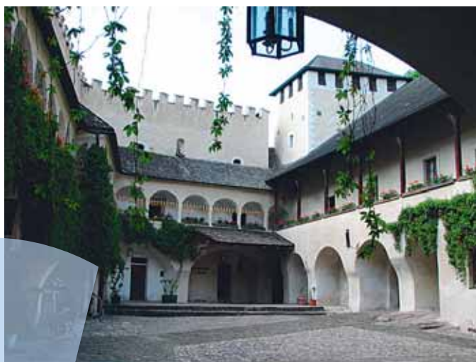
Weißkirchen/Wachau, Teisenhoferhof, Fassadenaktion