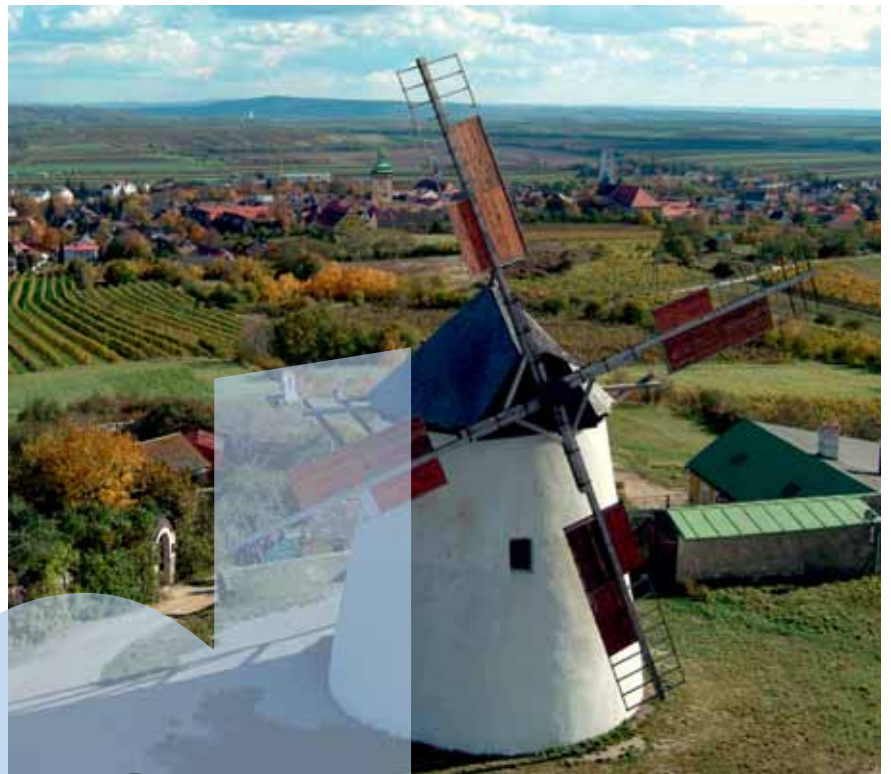
Retz, Windmühle