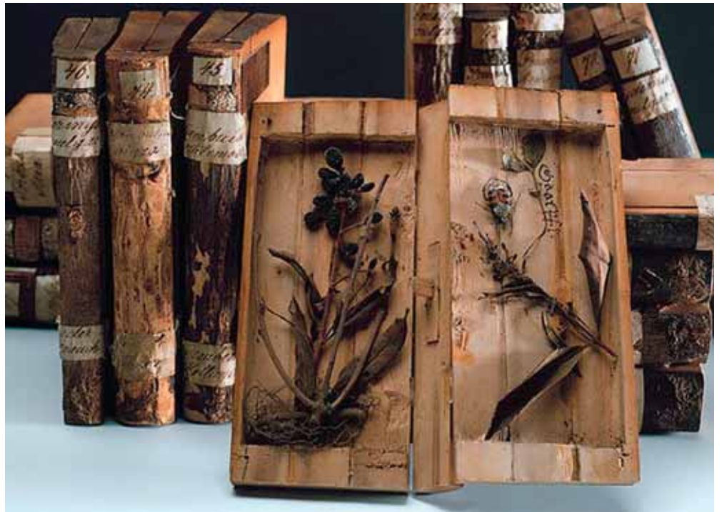
Holzbibliothek (Xylotheke)