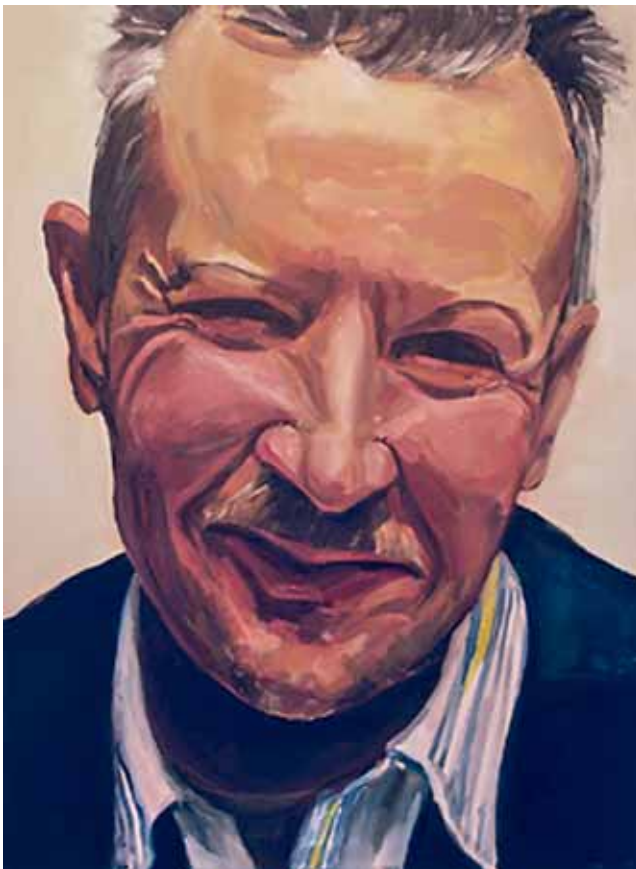
Hannah Feigl, «Julian Schutting», 2008, Öl/Leinwand Foto: © Feigl Hannah