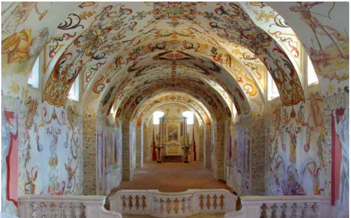
Benediktinerstift Altenburg Krypta