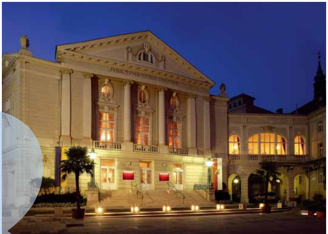
Baden, Stadttheater nach Renovierung