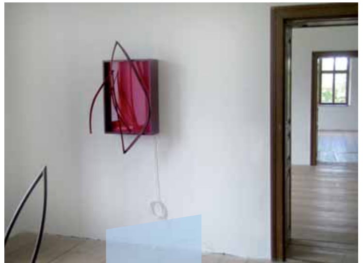
Blau Gelbe Viertelsgalerie Weistrach