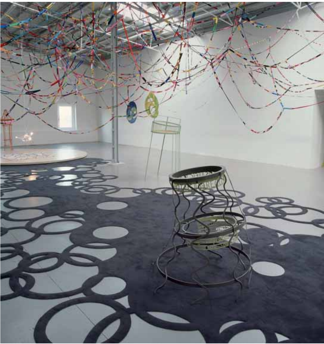
«TWILIGHT ZONE», Gilbert Bretterbauer – Installationsansicht, Kunstraum Niederösterreich