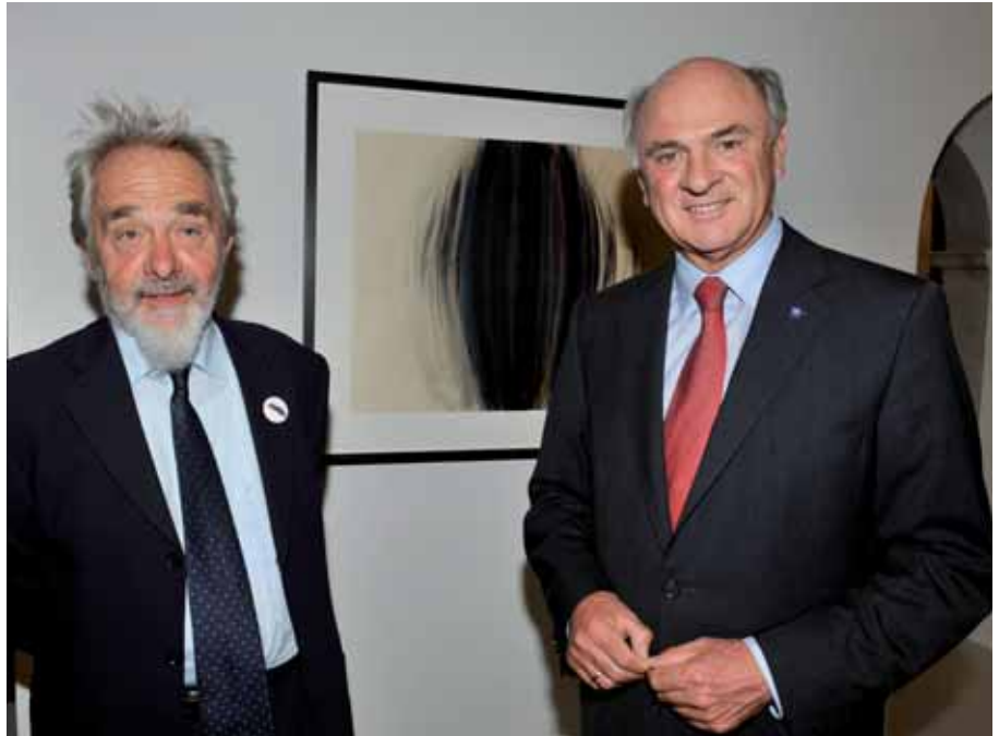
Eröffnung Arnulf Rainer Museum, 25. September 2009