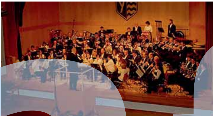
«Blasorchesters Alpenvorland», © Foto: Musikschulverband Ruprechtshofen-St. Leonhard/Forst