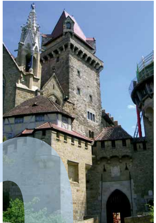
Burg Kreuzenstein, Haupttor