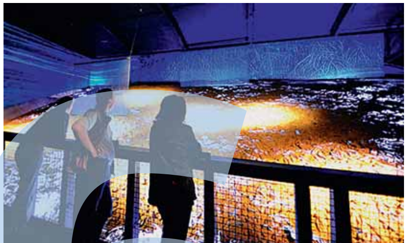
Fossilienwelt Weinviertel, eröffnet am 6. Juni 2009