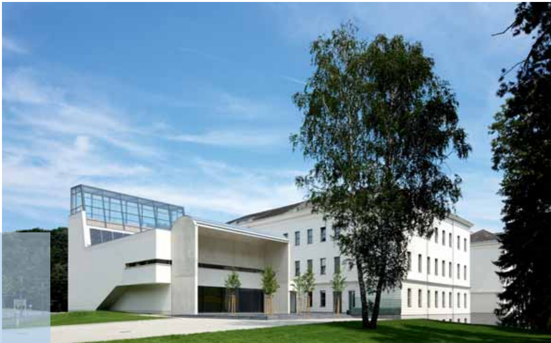
IST Austria, Klosterneuburg