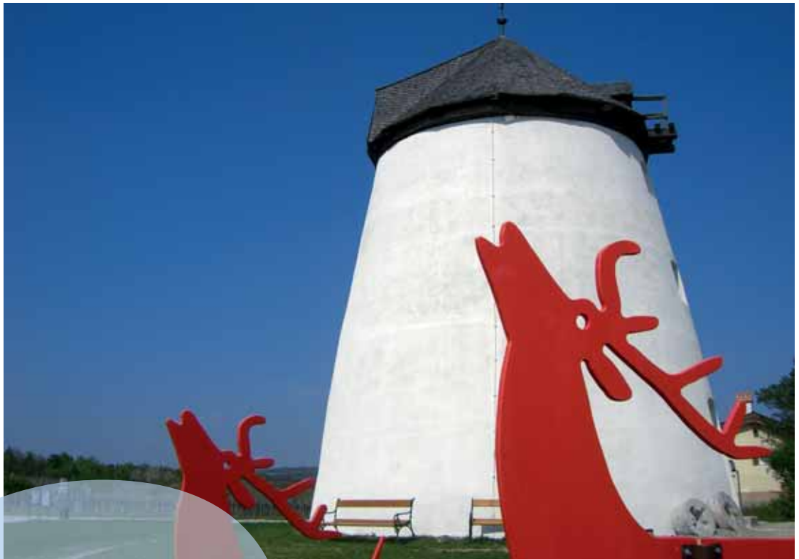
Viertelfestival Niederösterreich unter dem Motto «drehmoment» im Weinviertel, 2009