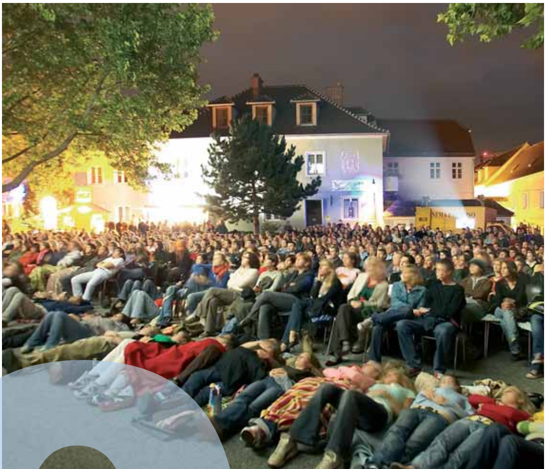
Sommerkino Niederösterreich