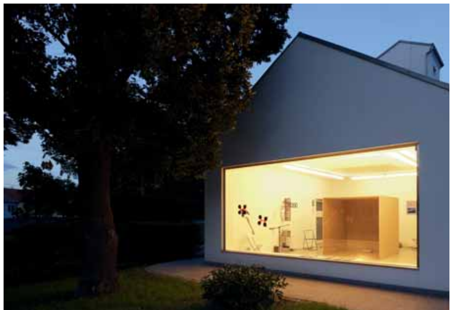
Weikendorf, Kunstraum