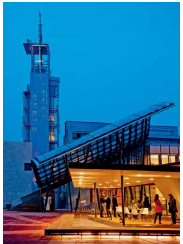
Kulturbezirk St. Pölten mit Blick auf Klangturm und der 2009 umgebaute Eingangsbereich des Landesmuseums Niederösterreich