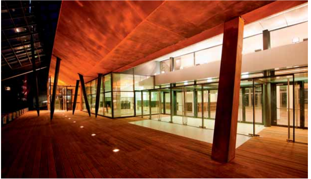
Landesmuseum Niederösterreich, Eingangsbereich nach Umbau