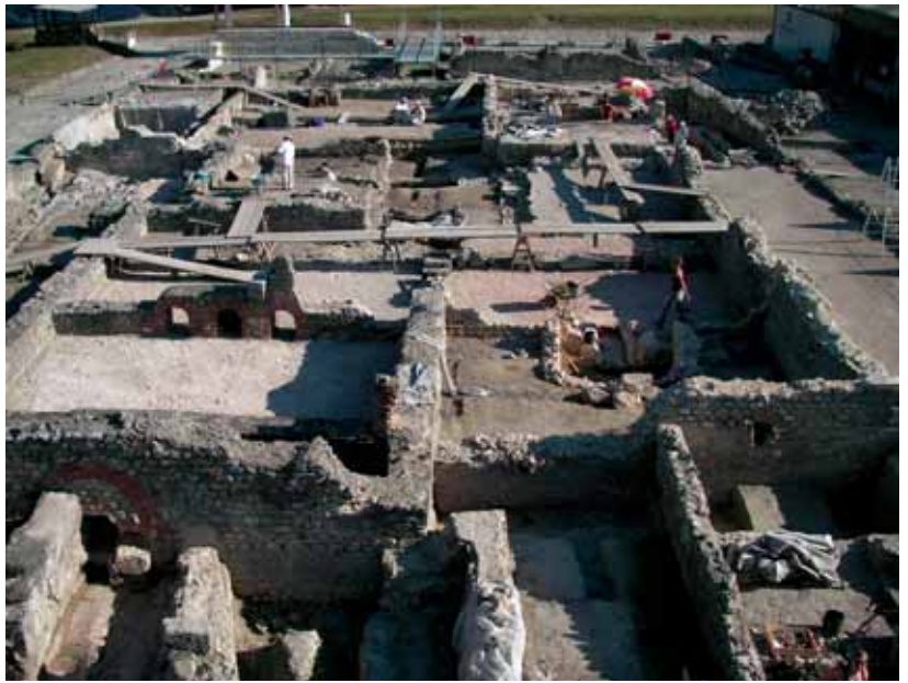
Ausgrabungen in der Therme von Carnuntum